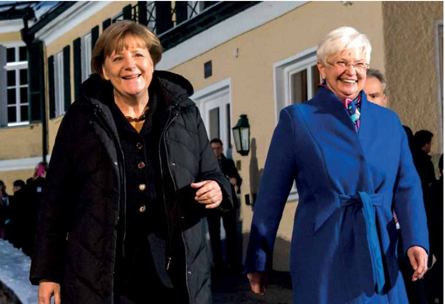
Angela Merkel Bundeskanzlerin der Bundesrepublik Deutschland und Vorsitzende der Christlich Demokratischen Union (CDU)